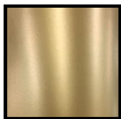
UV-H ゴールド純金粉色(極) 赤口 (超光輝性)