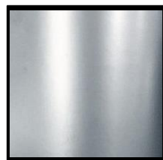
UV-H ゴールド 特銀色 (光輝性)