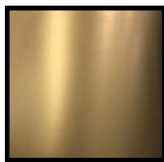
UV-H ゴールド特金色 赤口 (光輝性)