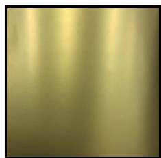
UV-H ゴールド特金色 青口 (光輝性)