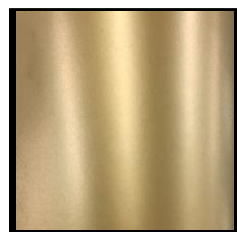
UV-L ゴールド 特金粉色 赤口 (明るい 濃度感)