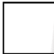
UV-パールホワイト 白口 (白い輝き)